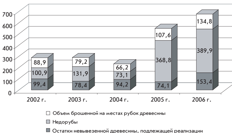
Рис. 2. Динамика нарушений правил отпуска древесины по Иркутской области за 2002–2006 гг., тыс. м 3 (по материалам Агентства лесного хозяйства Иркутской области)